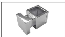
Appendiaccappatoio / Bathrobe hanger / Халат вешалка